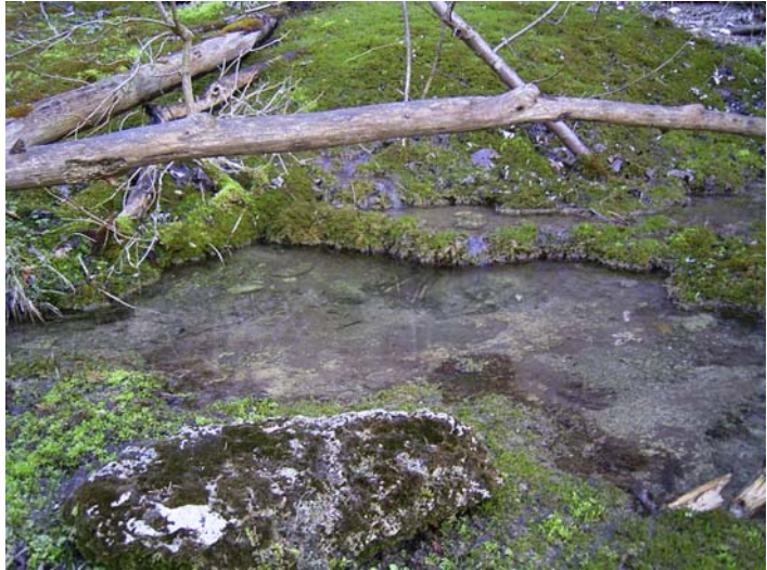
Abb. 2: Salamander-Fundort bei Hinterthan (Isen-Sempt-Hügelland) und Kalktuffbecken am Fundort „Wanderweg Enseldorf-Guttenburg“ (Unteres Inntal).